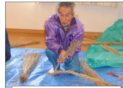
プロの技が光ります