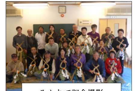
みんなで記念撮影