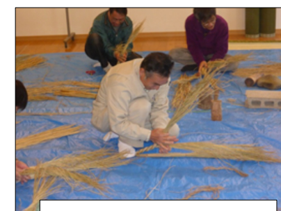
慣れた手つきで、上手です