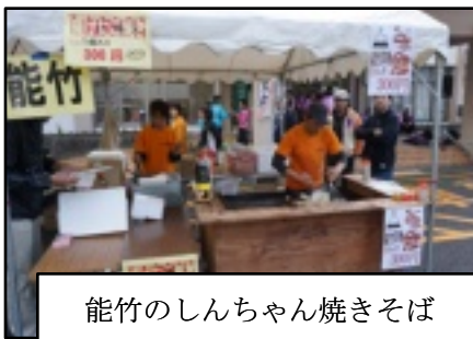
能竹のしんちゃん焼きそば