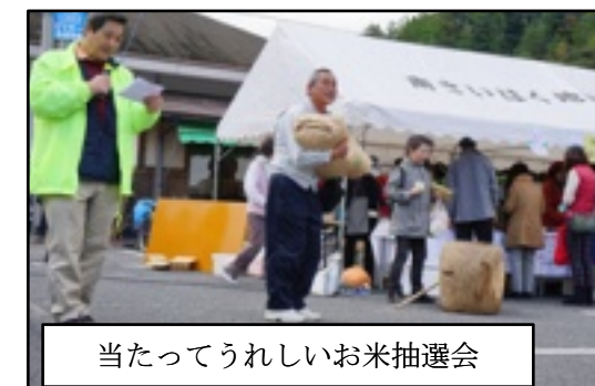
当たってうれしいお米抽選会