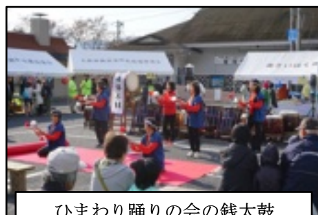
ひまわり踊りの会の銭太鼓