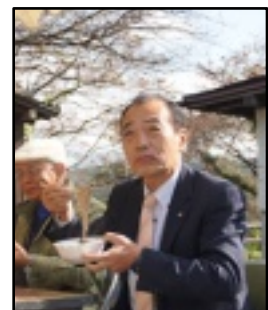
陶山町長も江原そばでほっこり