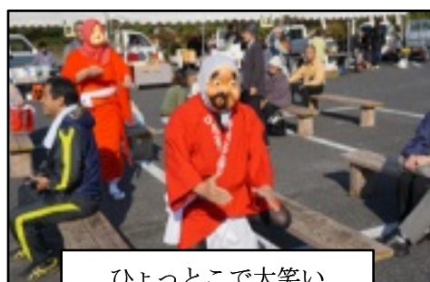
ひよっここで大笑い