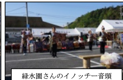
緑水園さんのイノッチー音頭