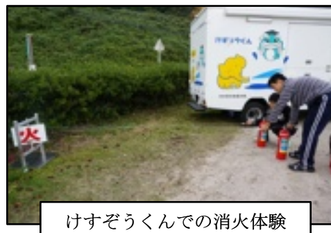
けすぞうくんでの消火体験